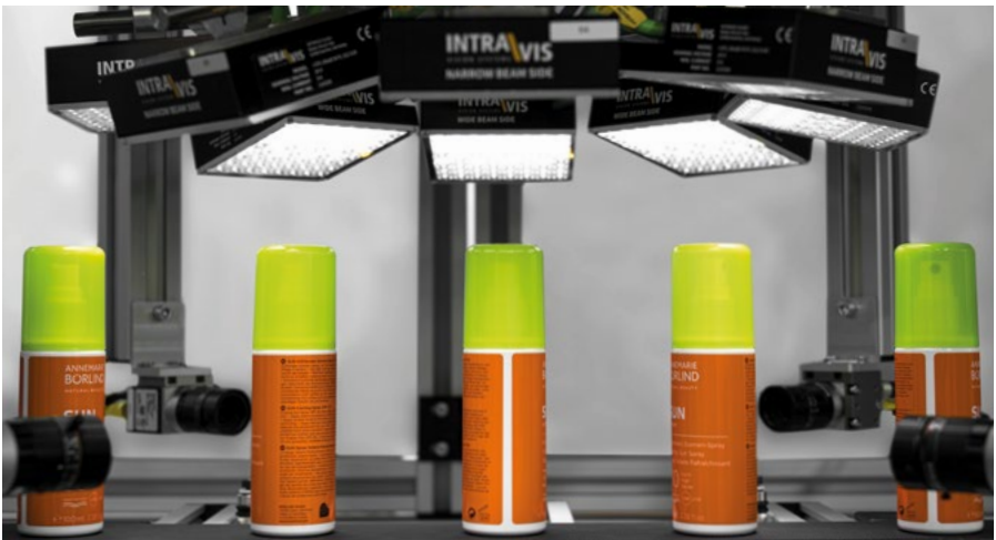
Etikettenkontrolle für unorientierte Objekte - LabelWatcher 360°

Dank einer neu entwickelten Bildgebung sowie eines speziell für den