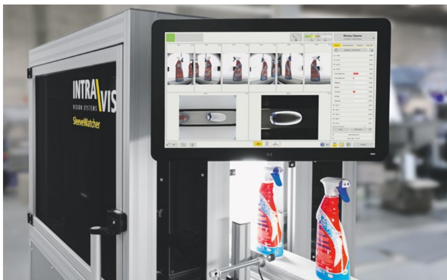
Bildverarbeitungssystem zur Erkennung von sleeve-spezifischen Fehlern

gestimmte Hardware und die IntraVision-Software sind optimal auf die anspruchsvollen Eigenschaften von Sleeve-Etiketten ausgerichtet. So garantiert der SleeveWatcher eine umfas-