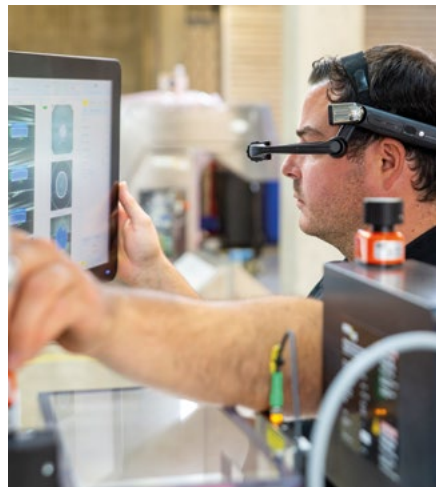
Fernwartung durch unsere Servicetechniker

Und wenn Sie neue Mitarbeiter haben, können Sie bei Bedarf jederzeit eine Schulung für Ihre INTRAVIS-Systeme buchen.